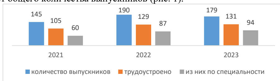
Рис. 2. Трудоустройство выпускников филиала в период 2021–2023 гг.

По сведениям, имеющимся на 1 октября 2023 года: трудоустроен 131 выпускник очной формы обучения, что составляет 73% от общего выпуска, 7 выпускников (4%) призваны в ряды Вооруженных Сил РФ, 29 человек не трудоустроено, либо по ним отсутствует информация, что составляет 16% от общего количества выпускников (рис. 1).